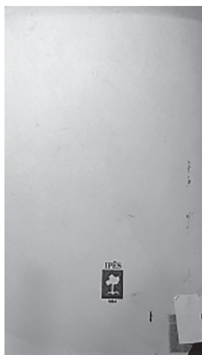
Capa e contracapa da 4ª edição dos Cadernos Nacionalistas.